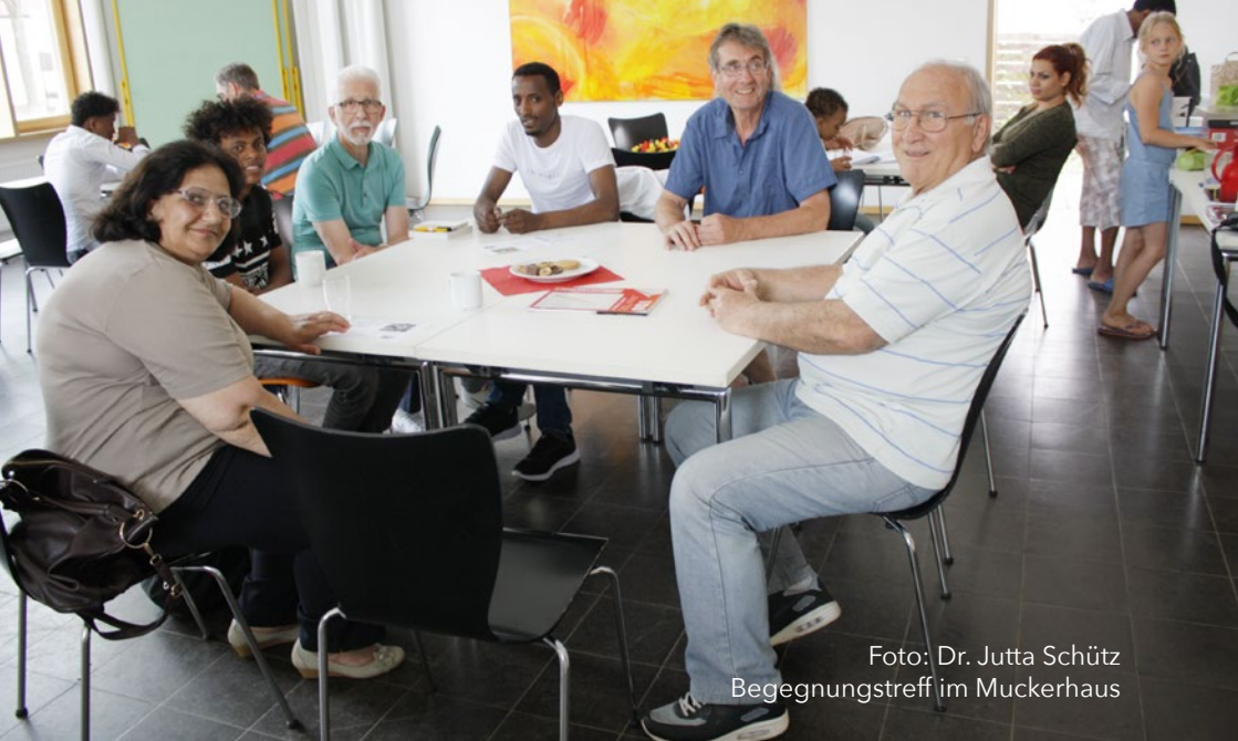
Begegnungstreff im Muckerhaus